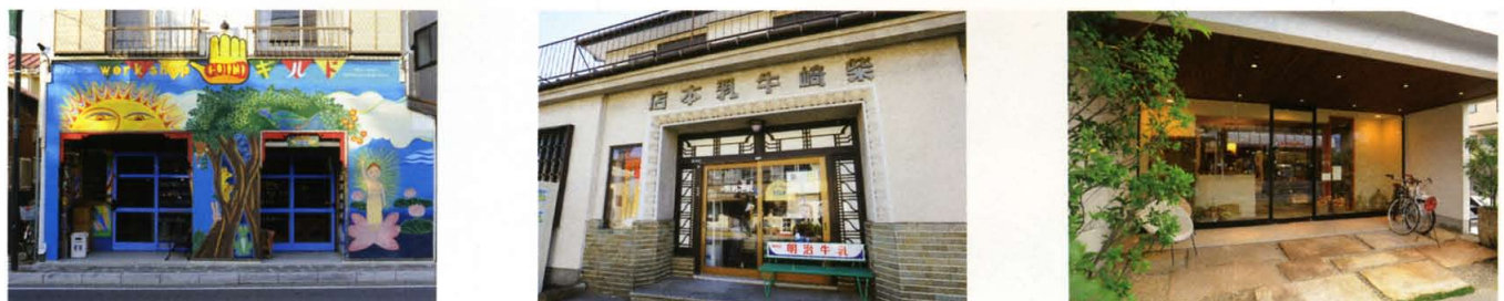
Retro Modern Street