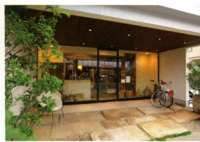
Retro Modern Street