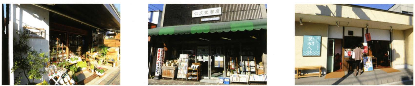
1 2 3 1.思わず目に留まるド派手な外観のアクセサリショップ ギルド。2.明治20年創業の柴崎牛乳本店。店の入口はかつてのまま。3.奥まった入口ながらも存在感を放つオールドレヴィーノ。4.もともと魚屋だった古い建物をほとんどそのまま利用している雑貨&花屋のアピアント。5.ここに移って50年以上。古書や古い雑誌を扱う公文堂書店。6.地元の人々の社交場にもなっている、たい焼き なみへい